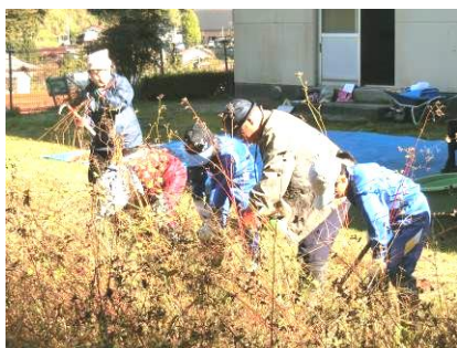
地域の方に習って刈り取り

春にまいた種が成長し、たくさんのそばができました。3、4年生と地域の方とでそばの収穫をしました。鎌で刈り取った後、今は珍しい足踏み脱穀機で脱穀しました。たくさんのそばが取れ、そば打ちをして食べるのが楽しみです。