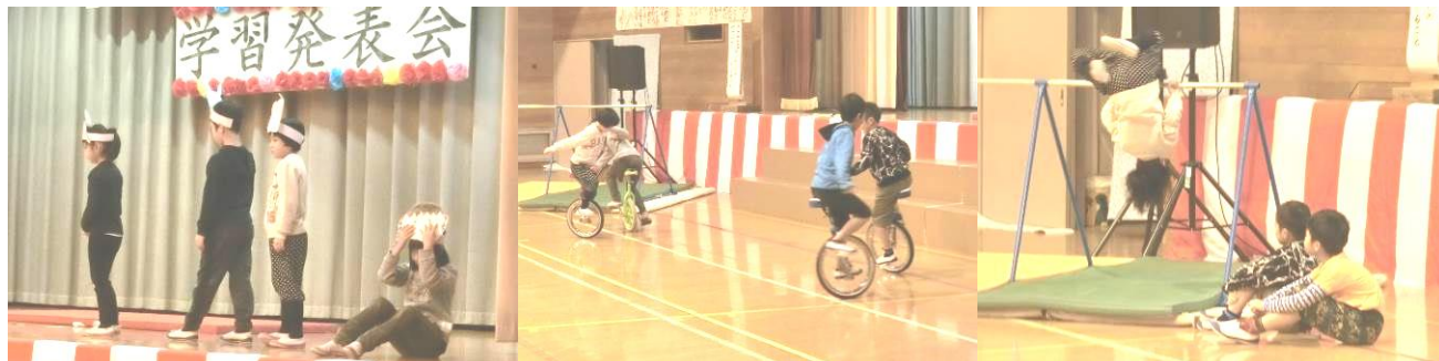
名前を見てちょうだい

2年生は国語の教科書に載っている「名前を見てちょうだい」の劇を大きな声で表情豊かに発表することができました。一輪車は1、2年生全員乗ることができます。二人で手をつないで回ると場内からは大きな拍手が起きました。