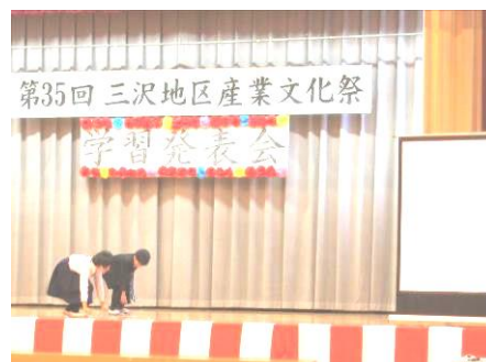
そばの種まきの様子を再現