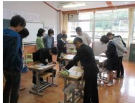
5,6年「わたしって だれ？」