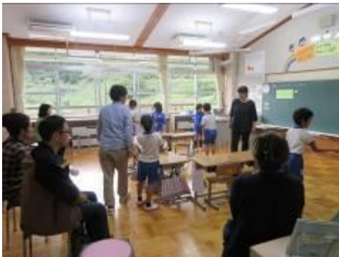
2年、さくら「四つの窓」