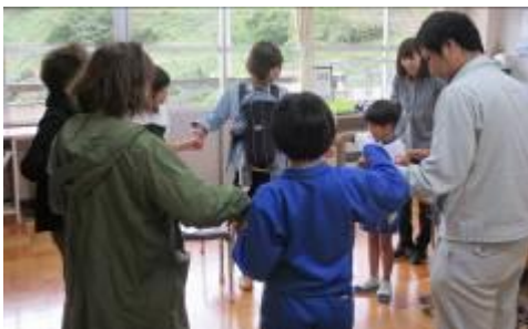
3,4年「自分らしさってなんだろう？」