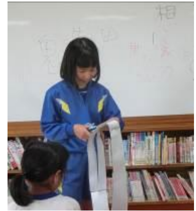
メビウスの輪を作る児童